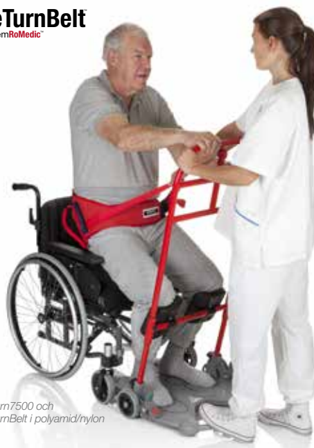
ReTurn7500 och ReTurnBelt i polyamid/nylon

Vårt patenterade* SystemRoMedic™ ReTurnBelt är ett utmärkt komplement till Handicares ReTurn överflyttningsplattformar. För brukare med svaga ben och som behöver extra stöd.